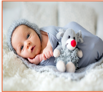
(Bebekleri olan aileye)