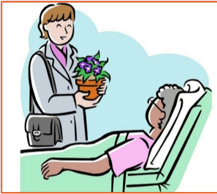
(Bir hasta ziyaretinde)