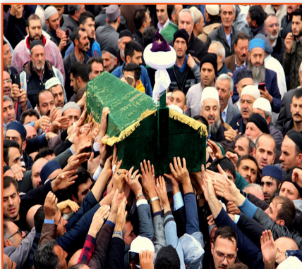
(Biri vefat ettiğinde yakınlarına)