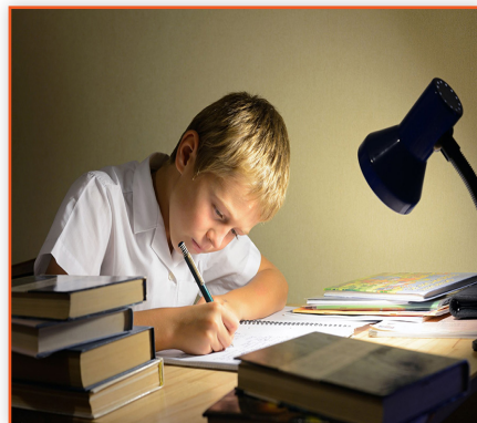
(Ders çalışan kimseye)