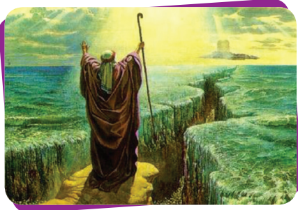
Asası ile Kızıldeniz'i iki yarması