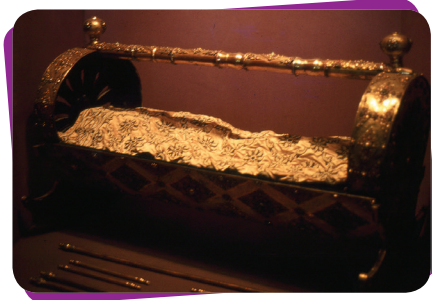
Beşikte iken konuşması