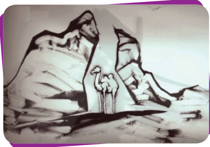
Kayanın içinden deve çıkarması