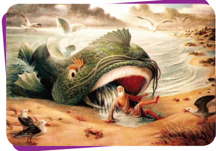
Balığın karnında yaşaması