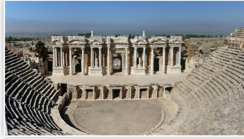
Hierapolis Antik Kenti